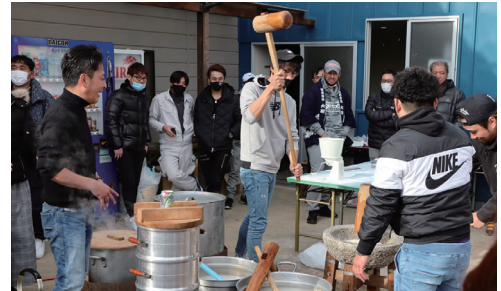
レクリエーション 「人間繁盛のために」