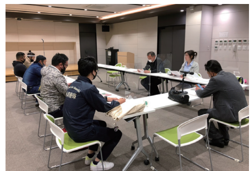
勉強会 「自己覚知を強みに」