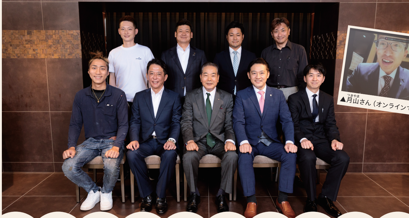
つきやま ▲月山さん (オンラインで参加)